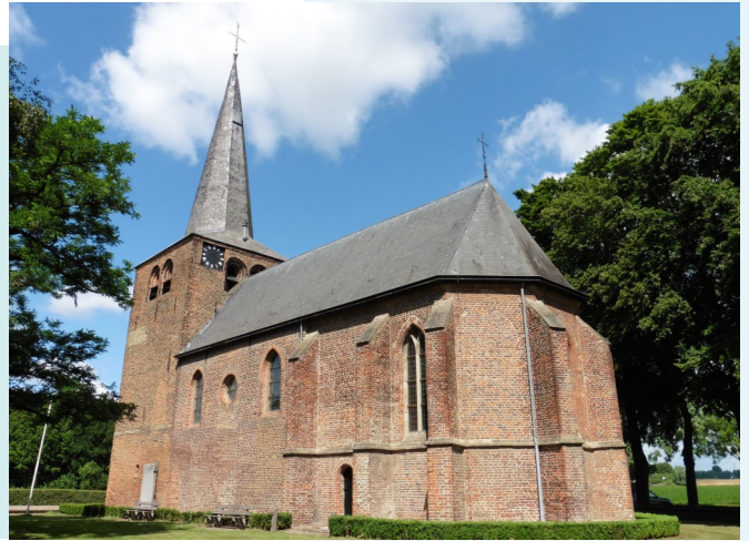
De oude parochiekerk van Velp

Het transcriberen is een langdurige klus geweest. Circa 1996/7 kreeg ondergetekende toestemming van het toenmalige kerkbestuur om in de al enkele jaren leegstaande pastoriewoning onderzoek te doen naar heren der opgeborgen oude stukken. Uiteindelijk resulteerde dat in het overbrengen van het 'archief' naar het Streekarchief in Grave.