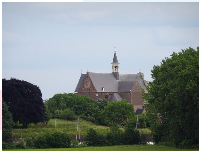
De Sint-Elisabethkerk anno nu; monumentaal middelpunt van de oude vestingstad Grave

Mij present, P.H. Jongedijk, gezwore clercc