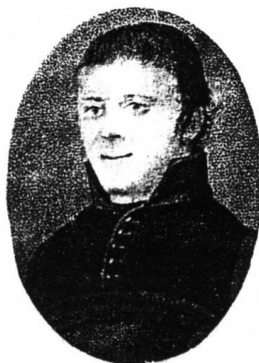
The Rev. Theodore J. Vanden Broek, O. P. Priest, missionary, and colonizer.

Op 1 november 1851 vierde men in Little Chute het feest van Allerheiligen. Na de Mis werd hij getroffen door een beroerte. Hij bleef bewusteloos en stierf op 5 november, 67 jaar oud. Vier dagen later werd hij begraven op het kerkhof naast de kerk. Toen de kerk jaren later vergroot werd, bouwde men over zijn graf. In 1894 werden zijn stoffelijke resten teruggevonden en in 1928 bijgezet in een koperen kistje aan de binnenkant van de toren van de kerk.