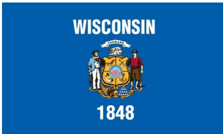
Vlag met het motto “ Forward ”

Wisconsin is nu een landbouwstaat en de belangrijkste kaasproducent in de Verenigde Staten (er wordt zelfs Gouda kaas gemaakt); het wordt ook wel de “ Dairy State ” (zuivelstaat) genoemd.