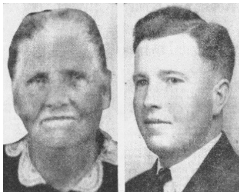
KILLED IN DOUBLE MURDER

brute wijze vermoord met een jachtgeweer in hun huis net buiten Freedom. Ondanks jarenlang onderzoek, werd(en) de dader(s) nooit gevonden.