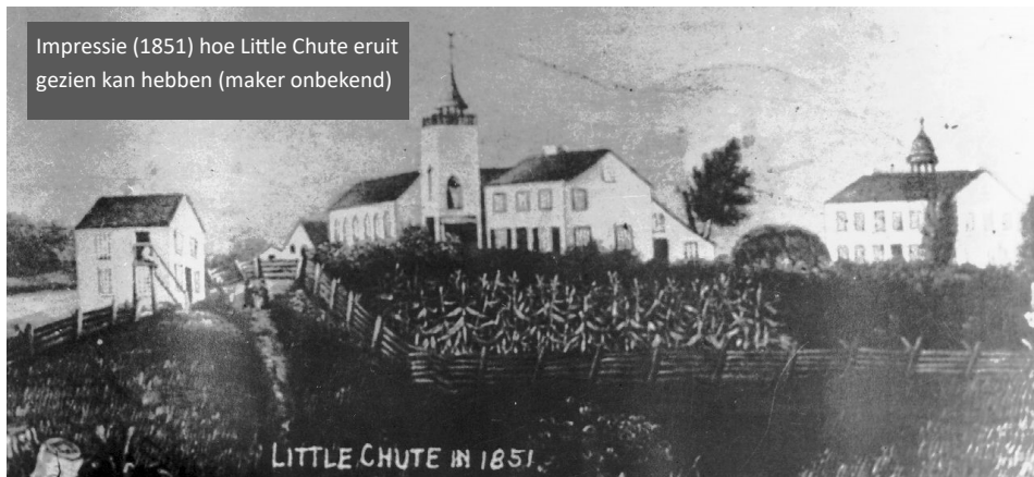
Impressie (1851) hoe Little Chute eruit gezien kan hebben (maker onbekend)