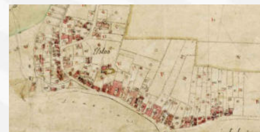
Kadastrale kaart Elsloo

Je kunt je hier aanmelden voor het bijwonen van deze lezing. Deelname voor NGV-leden is gratis, voor niet-leden geldt een entree van € 5,00 p.p. (à contant).