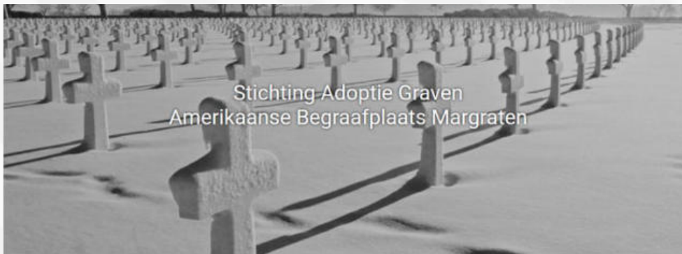
Stichting Adoptie Graven Amerikaanse Begraafplaats Margraten