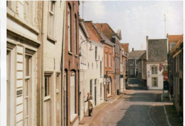
Ravenstein, Kolonel Wilsstraat

werkzaam bij de gemeente Utrecht, weer op de afdeling Monumenten.